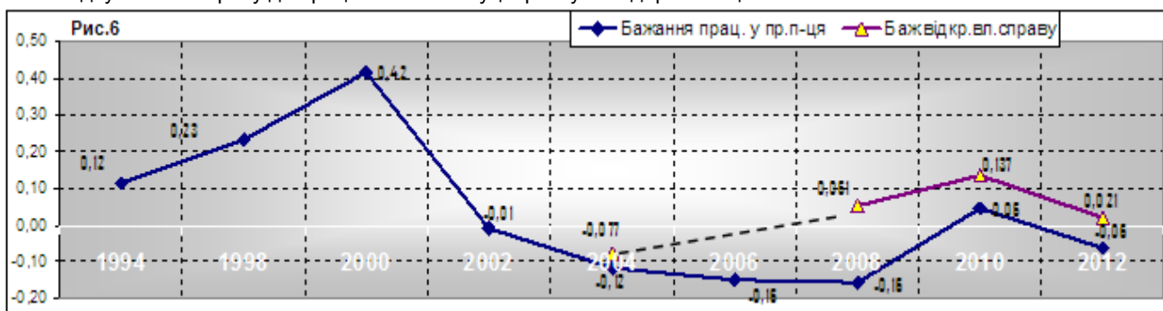
Рисунок 3. - Динаміка поляризації населення щодо бажання відкрити власну справу, та чи працювати у приватних підприємств (I).

Відсутність позитивних зрушень у ставленні до приватного бізнесу лінійно відображає і відносно затишшя у бажанні відкрити власну справу, та у згоді працювати у приватних підприємств (див. Рис.3). Позитивна динаміка спостерігалася після кризи 2007 р. і до 2010 р. З приходом до влади нової політичної сили (опускаючи політичне забарвлення аргументації) ці показники, як і попередні показують своєрідну «ізоляційність», а не відсутність інтересу до процесів та інституцій ринку та підприємництва.