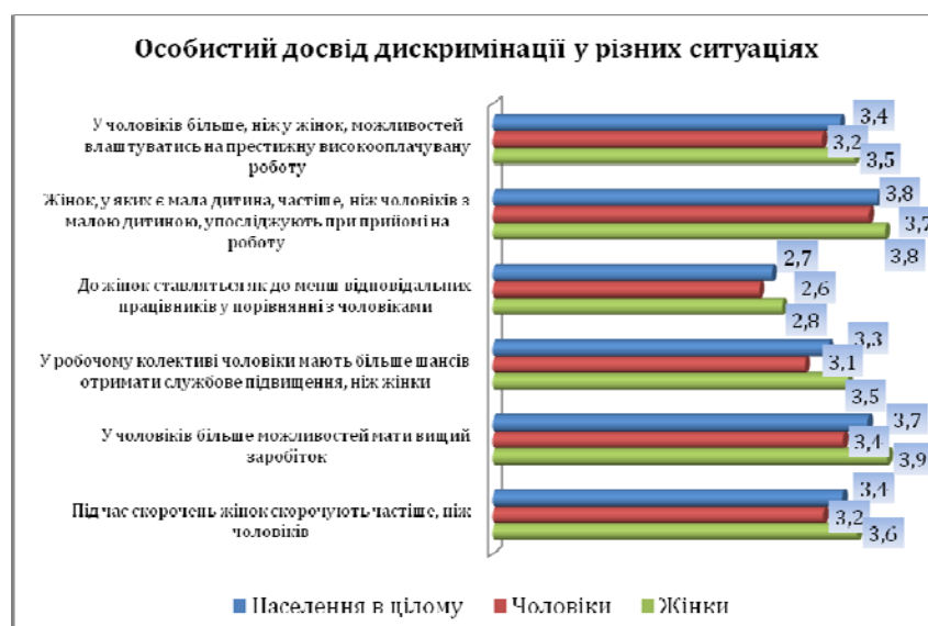
Рис. 3. Особистий досвід ґендерної дискримінації у різних ситуаціях Порівняння середніх арифметичних значень відповідей на запитання за шкалою від 1 – "ніколи" до 5 – "постійно"; обсяг вибірки населення в цілому n_1 не менше 1222, підвибірки чоловіків n_2 не менше 444, підвибірки жінок n_3 не менше 777