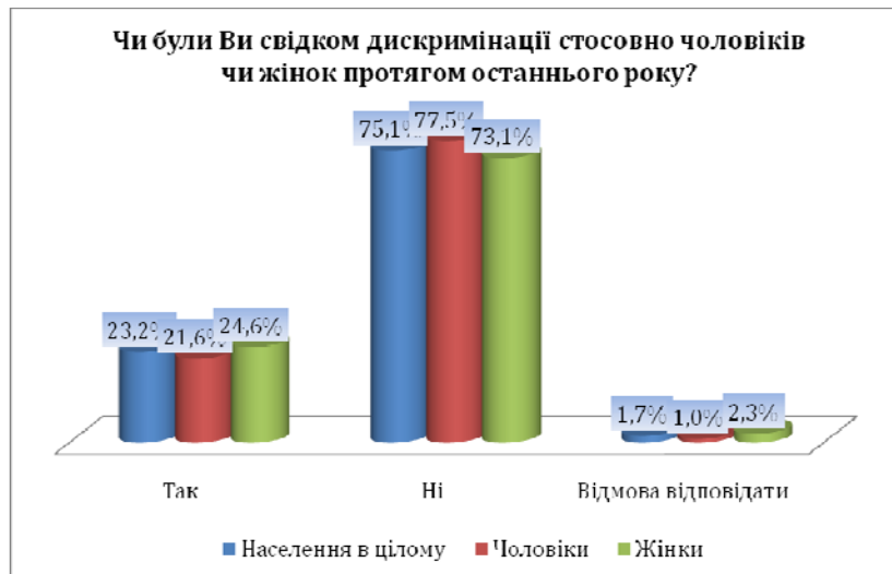
Рис. 1. Особисті свідчення про ґендерну дискримінацію розподіл відсотків відповідей на запитання; обсяг вибірки населення АР Крим в цілому n_1=1217 , підвибірки чоловіків n_2=440 , підвибірки жінок n_3=778